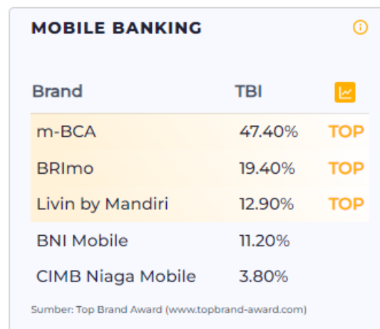
Gambar 1. Top Brand Index Mobile banking

Salah satu layanan mobile banking terkemuka di Indonesia adalah Livin' by Mandiri, aplikasi yang dikembangkan oleh PT Bank Mandiri (Persero) Tbk. Aplikasi ini merupakan hasil transformasi dari Mandiri Online yang diluncurkan pada Oktober 2021, dan terus dikembangkan sebagai bagian dari strategi digitalisasi perbankan 4.0 (Damayanti, 2023). Dalam kurun waktu dua tahun, Livin' by Mandiri berhasil mencatatkan pertumbuhan pengguna yang sangat pesat. Berdasarkan penelitian Juliani dan Riofila (2024), jumlah pengguna meningkat dari 15,8 juta pada tahun 2022 menjadi 27 juta pada tahun 2024, mencerminkan keberhasilan strategi digital dan pemasaran yang dijalankan oleh Bank Mandiri.